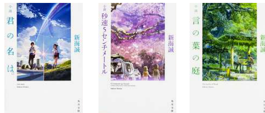
著者名：新海誠 発行：KADOKAWA