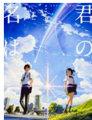
著者名：新海誠 発行：KADOKAWA