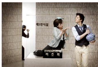
▼「ラブ・トレジャー」