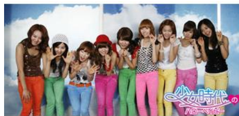
▼「少女時代のハローベイビー」